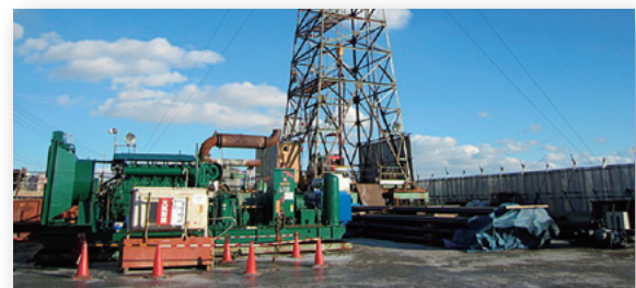
使用した掘削機械(リグ)