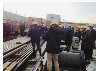
掘削工事の現場視察