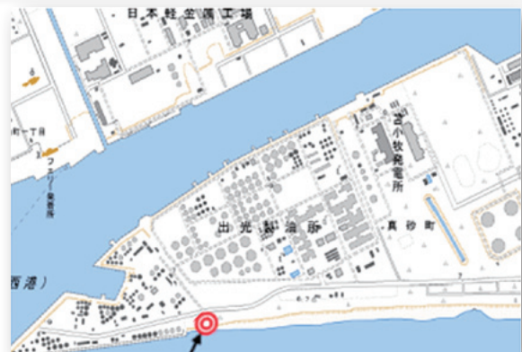
萌別層観測井位置